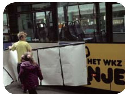
Onthulling van de bussticker door een van de kanjers

Met een opvallende 'kanjercampagne' zijn patiënten van het Wilhelmina Kinderziekenhuis zelf op zoek naar kanjers van nieuwe medewerkers. De landelijke campagne richt zich op werving van (IC-) kinderverpleegkundigen, operatieassistenten en anesthesiemedewerkers. De kanjers van het WKZ, zoals de kinderen zichzelf noemen, proberen daarbij zoveel mogelijk media-aandacht te krijgen voor hun wervingsboodschap.