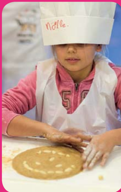
Aan de slag bij een workshop banketbakken

den. Activiteiten die voor en door kinderen worden uitgevoerd en waarbij plezier, ontspanning en afleiding de belangrijkste doelen zijn. Zieke kinderen kunnen hier samen met hun familieleden en vriendjes, of onder begeleiding van een pedagogisch medewerker van de afdeling, een positieve ervaring beleven. Zo kunnen zij even de spanning, angst en verdriet - die nu eenmaal vaak samen gaan met een ziekenhuisopname - opzij zetten. Het activiteiten aanbod is divers. De ene woensdag is er theater, dan weer gaat het om muziek, cabaret of een dansvoorstelling door amateurs of professionals. De Ballonnenman, de Verhalenvertelster en Theater Tik... het zijn begrippen voor kinderen die regelmatig in het WKZ verblijven. De coördinator van het kindertheater organiseert kleinschalige activiteiten, maar ook regelmatig wat grotere evenementen, waarbij kinderen zelf en hun familie actief