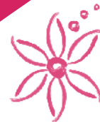
Vereniging Vrienden van het Wilhelmina Kinderziekenhuis

Het Wilhelmina Kinderziekenhuis, onderdeel van het Universitair Medisch Centrum Utrecht, is gehuisvest in een nieuw modern en kindvriendelijk gebouw met allerlei voorzieningen en faciliteiten om het verblijf voor kinderen en ouders zo aangenaam mogelijk te maken. Er wordt zorg geboden aan kinderen van nul tot achttien jaar en aan moeder en kind rondom de geboorte. Jaarlijks bezoeken zo'n 40.000 kinderen met hun ouders het kinderziekenhuis en worden ongeveer 7.500 patiënten opgenomen. Het ziekenhuis heeft 220 bedden.