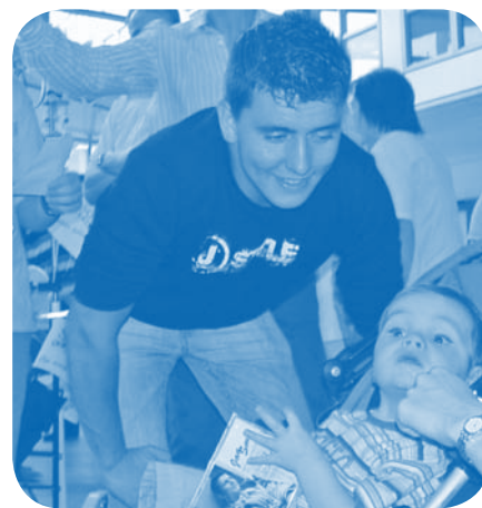
Jan Smit deelt handtekeningen en cd's uit aan kinderen in het WKZ

Op donderdag 14 september bracht zanger Jan Smit een bezoek aan het WKZ in het kader van de promotie van zijn nieuwe cd. Zijn promotietour ging per heliopter langs 8 verschillende zorginstellingen in Nederland. In het WKZ bezocht hij enkele afdelingen en deelde handtekeningen uit in de centrale hal. Alle kinderen ontvingen een gesigeneerde cd.